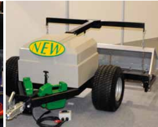
Double A Core Collector

tussenlaag van een importeur wordt er dus tussenuit gesneden. Volgens de standbemanning zou dit moeten leiden tot meer service voor de klanten, maar de motivatie zal ongetwijfeld ook financieel van aard zijn. Een tussenlaag eruit betekent meer marge voor de fabrikant, mogelijk lagere prijzen voor de eindgebruiker en dus uiteindelijk een betere concurrentiepositie.