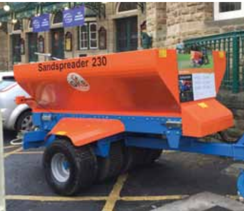
GKB Sandspreader op BTME.