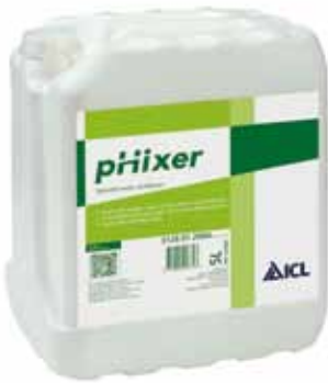
pHixer van ICL.

maar ook uit eigen wetting agents, graszaden en zaken als pHixer.