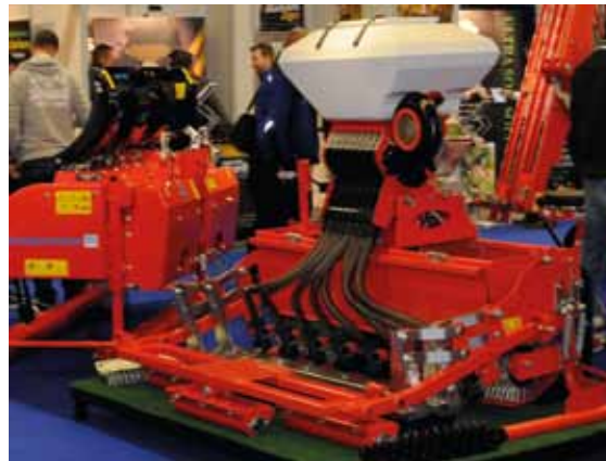
Wiedenmann-zaaimachine voor ultrafijn zaad.