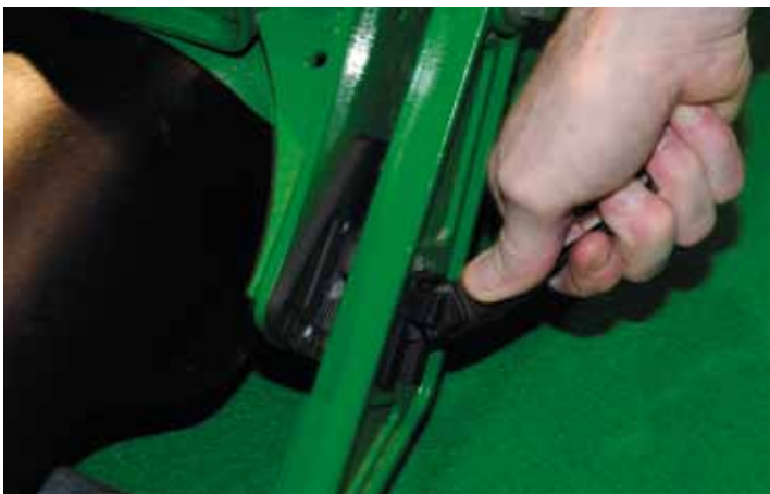
Makkelijke instelling van de maaihogte op de Terraincut 9009A.

Het nieuws van Campey betrof onder andere een aantal nieuwe rotors voor de Field Top Maker. Het oorspronkelijke idee van de Field Top Maker is dat hij werkt als een soort kaasschaaf, die een dunne laag van een veld affreest. De nieuwe maa- of freesklepels op de Field Top Maker maken het mogelijk om een veld te verticuteren op verschillende dieptes en met verschillende intensiteit. Ook op hybridevelden, waar je natuurlijk altijd bang bent dat je deze kunststof vezel beschadigt. Niet verwonderlijk dus dat een groot aantal Nederlandse bedrijven actief is in het VK. GKB is daarvan een voorbeeld, maar ook Vredo, Trilo en Redexim. Veel van die bedrijven nemen dat zelf zeer serieus. Redexim nam lang geleden Charterhouse over, maar vertegenwoordigt nu ook Graden. Ook GKB wil duidelijk een extra stap zetten in the UK en heeft sinds kort geïnvesteerd in én een eigen vestiging, en een Engelse verkoper, Tony Shinkins, die de markt moet gaan bestoken. Trilo, ten slotte, meldde op de beurs zijn dealers in Engeland voortaan direct te gaan beleveren; de