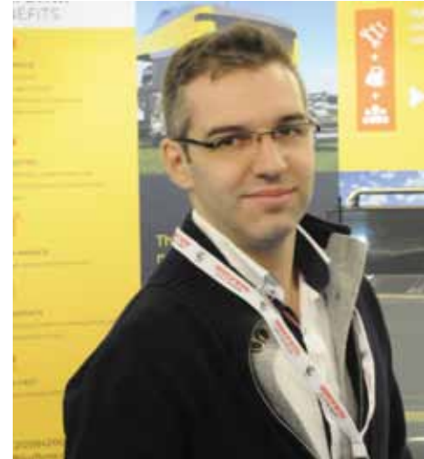
Turflynx, Joao Estilista

Een essentieel verschil met de maairobots van Probotiq is dat het geen omgebouwde traditionele fairwaymaaier is met een stoel en een stuur, maar een machine die alleen als robot kan worden ingezet. Dat bespaart natuurlijk geld, maar uiteindelijk zal dit ongetwijfeld ook banen van greenkeepers kosten. Als sector moet je misschien niet gelukkig zijn met deze ontwikkeling. Maar als bedrijven als Uber verwachten dat we straks te maken krijgen met onbemande taxi's, zal het lastig worden om deze ontwikkelingen te voorkomen.