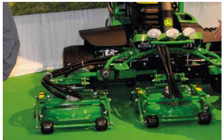
Cirkeldecks die makkelijk lossen.